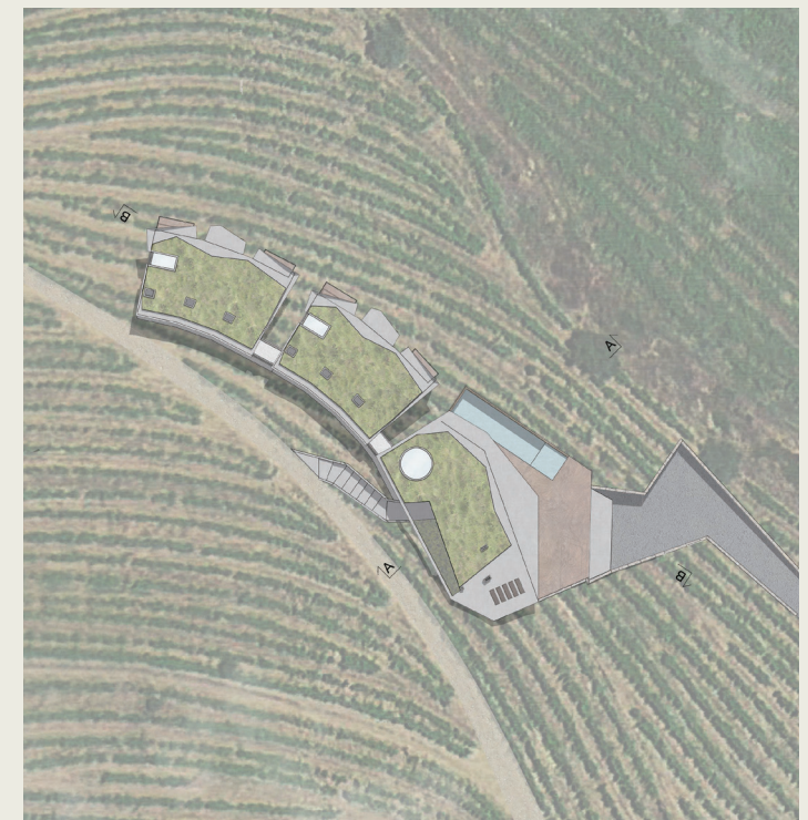
Roof floor plan

Saramagayo House is integrated into the monumental landscape of Alto Douro, at UNESCO World Heritage .