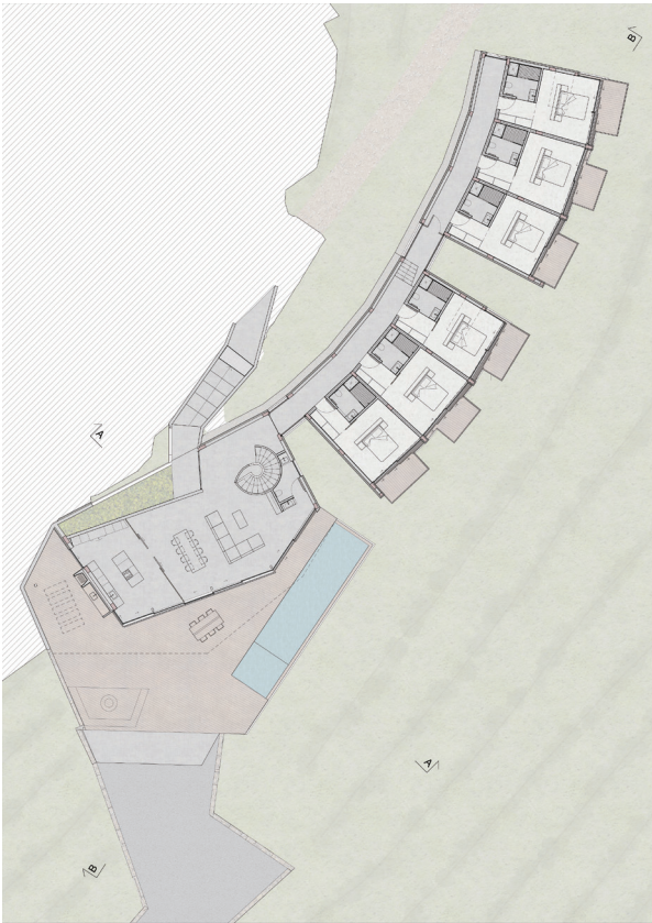
Floor plan II